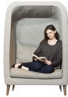
ノイズ低減ソファ事例