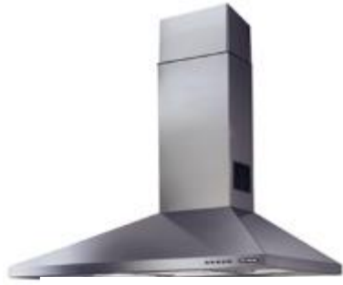
大型キッチンフード事例