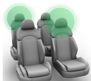
自動車シート4席事例